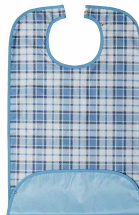
Con tasca chiusa